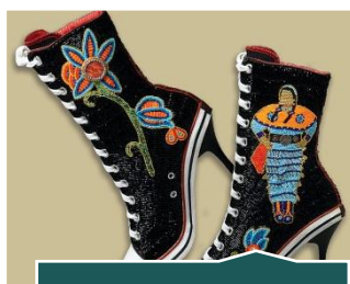
Glass Beads Dawn Dumont